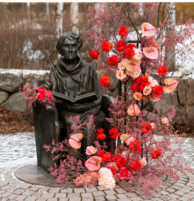
Astrid Lindgren, Junibacken, Stockholm.

I VÅR ORGANISATION värnar vi om att arbeta med välgörenhet och social hållbarhet. Vi är huvudpartner till Läkare Utan Gränser, och sedan 2018 samarbetar vi med Cancerfonden, där vi under 2023 var huvudpartner till Rosa Bandet-kampanjen. Sedan 2022 samarbetar vi också med Majblomman. Under 2023 samlade vi in drygt 3,9 msek till dessa organisationer vilket motsvarar 1 % av vår Blommogramförsäljning.